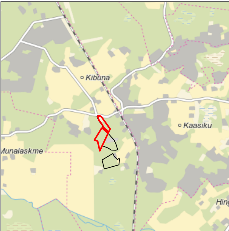
Kaardileht nr 6331 Keila